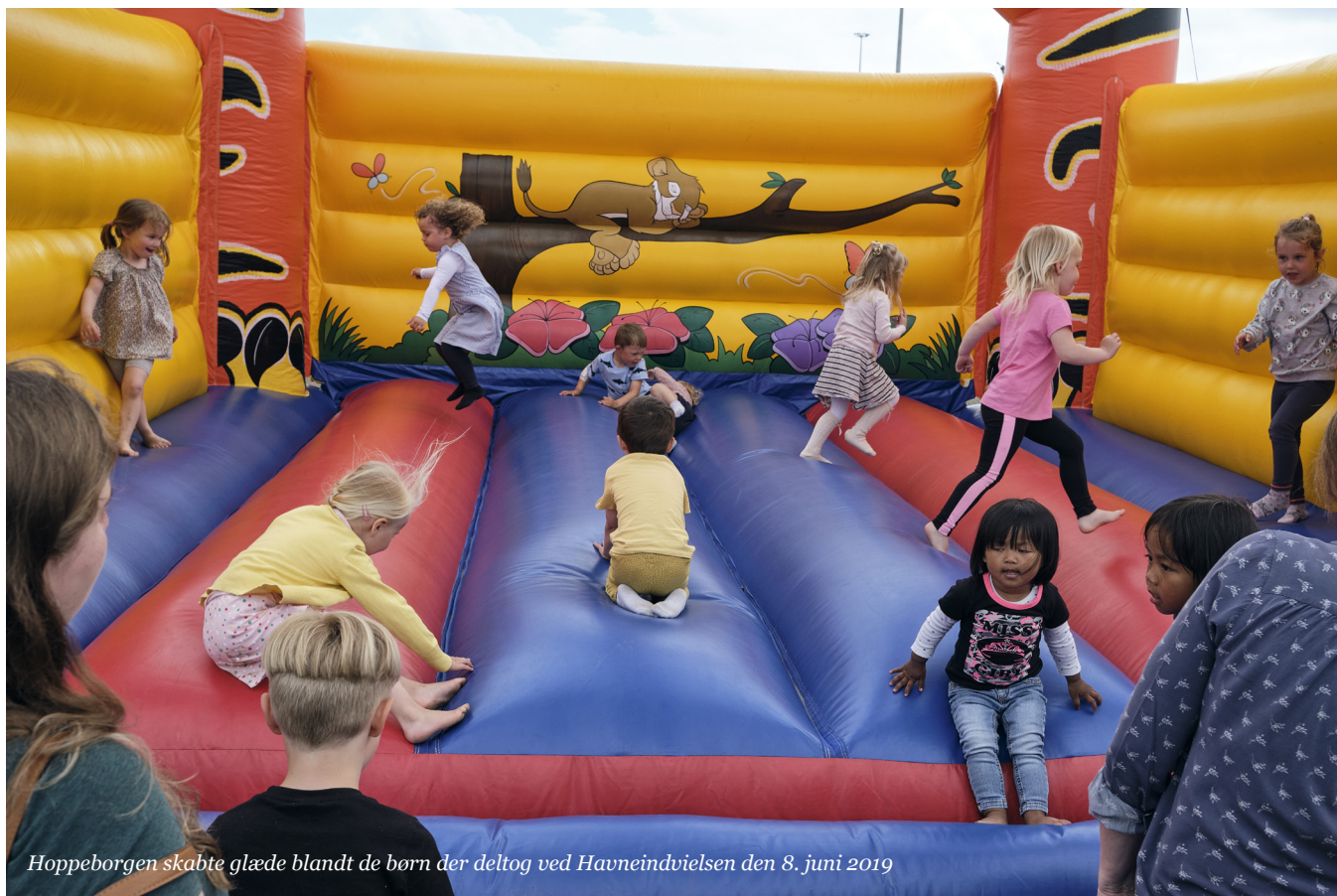
Hoppeborgen skabte glæde blandt de børn der deltog ved Havneindvielsen den 8. juni 2019

Som et andet socialt initiativ har Rønne Havn A/S i 2019 også indgået et samarbejde med 'Stop Madspild Lokalt – Bornholm'